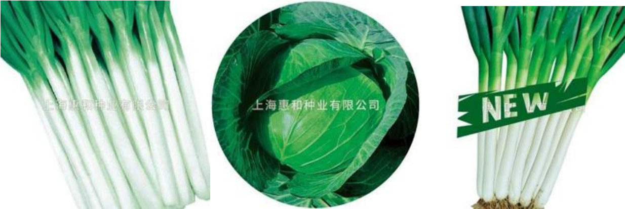
（从左至右依次为：“长宝”大葱、“海月”甘蓝、“普锐斯”大葱）

我协会理事单位上海惠和种业有限公司作为大葱、甘蓝等蔬菜种子的主要供应商之一，二十多年以来持续为种植户提供优质大葱种子，并且在不断推出更具市场竞争力的大葱、甘蓝的新优品种。以下为该公司近期研发三款典型新优品种的介绍。