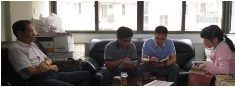
图为市商委市场调控处有关同志在我协会秘书处