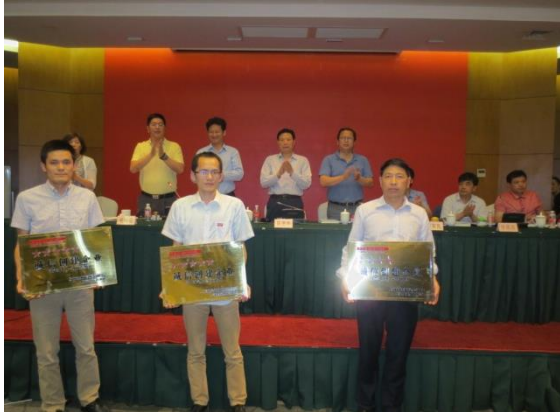
图为主席台领导给“企业诚信创建”新认定的企业授