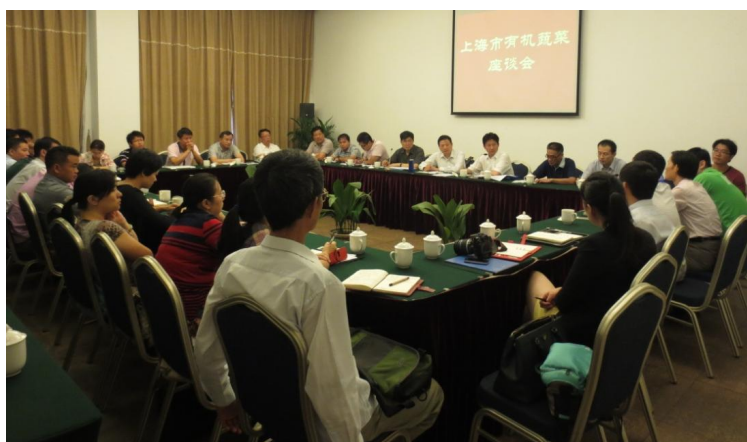
图为有机蔬菜座谈会现场