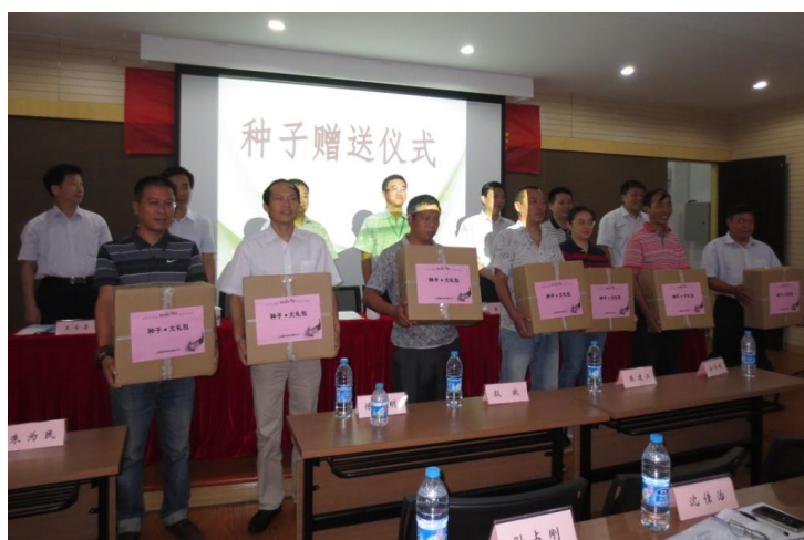
图为：上海惠和种业有限公司向我协会部分会员单位（上海的核心园艺场）赠送种子大礼包

8 月 27 日上午，市农委蔬菜办公室，市农业技术推广服务中心，上海蔬菜食用菌行业协会等在上海种子行业协会会长单位、本协会理事单位——上海惠和种业有限公司举行蔬菜品种推介会。我协会部分会员单位，各区县蔬菜办主任及有关方面领导共 150 余人出